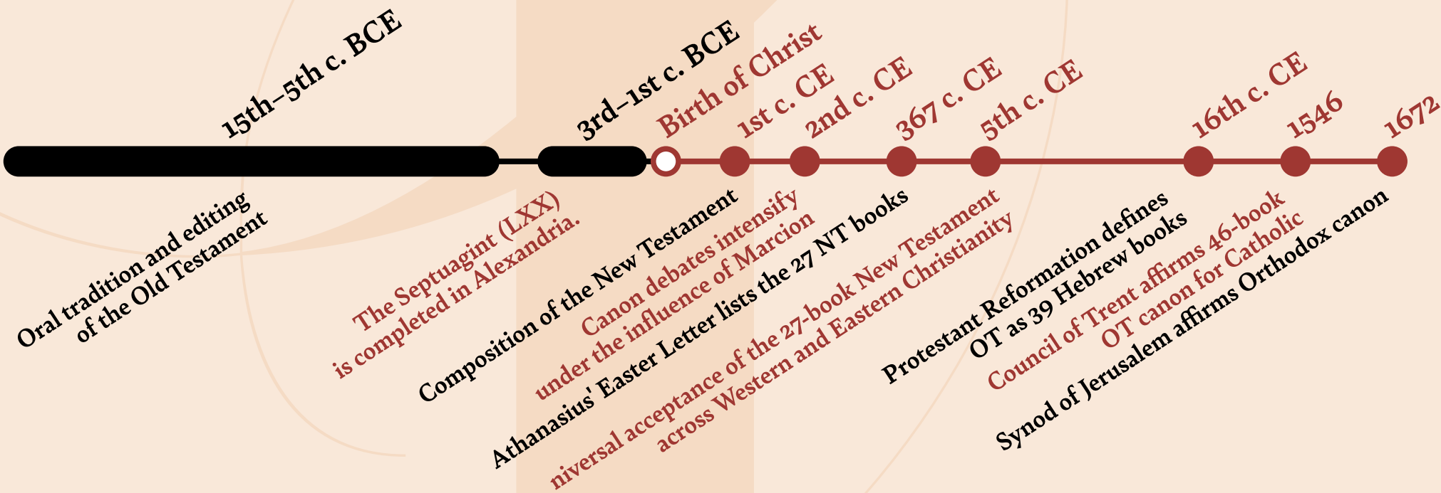
Major Bible Translations and Their Cultural Impact